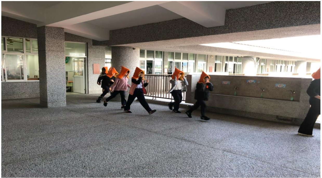
活動說明：進行防災疏散演練