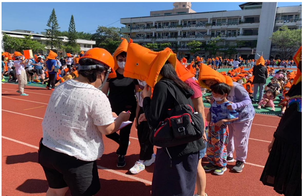
活動說明：人數清點