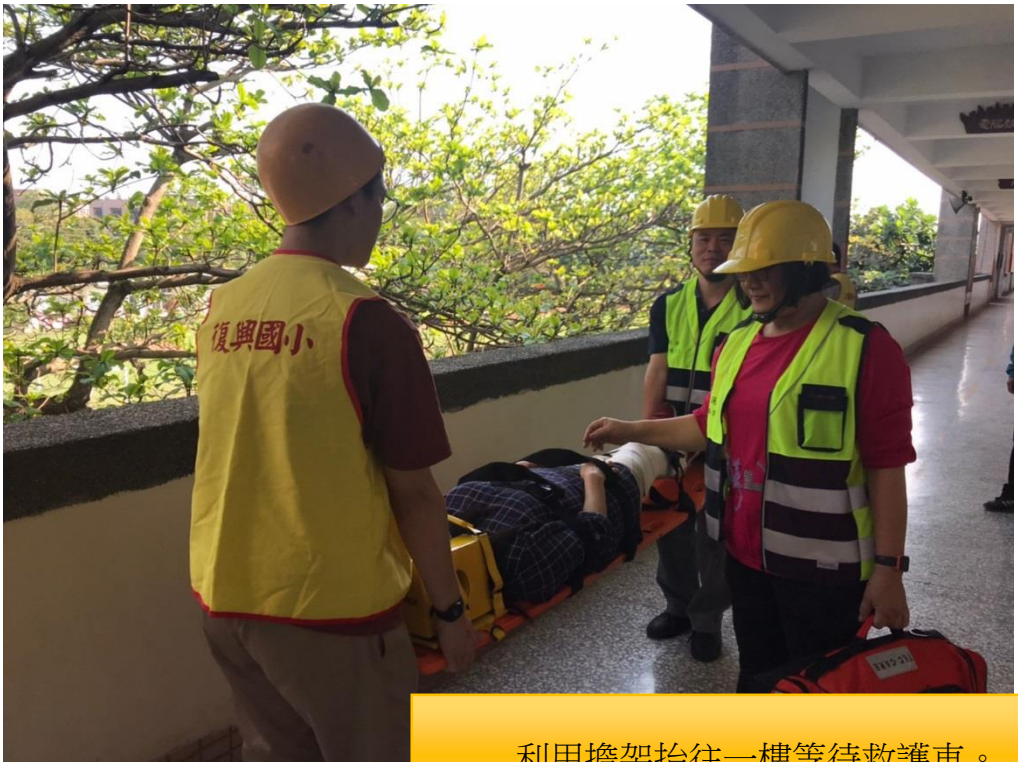
利用擔架抬往一樓等待救護車。