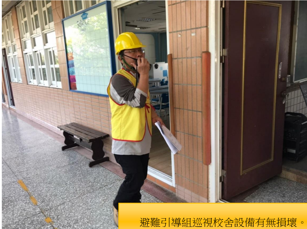
避難引導組巡視校舍設備有無損壞。