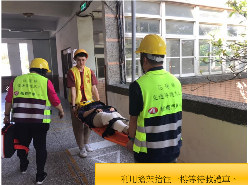
利用擔架抬往一樓等待救護車。