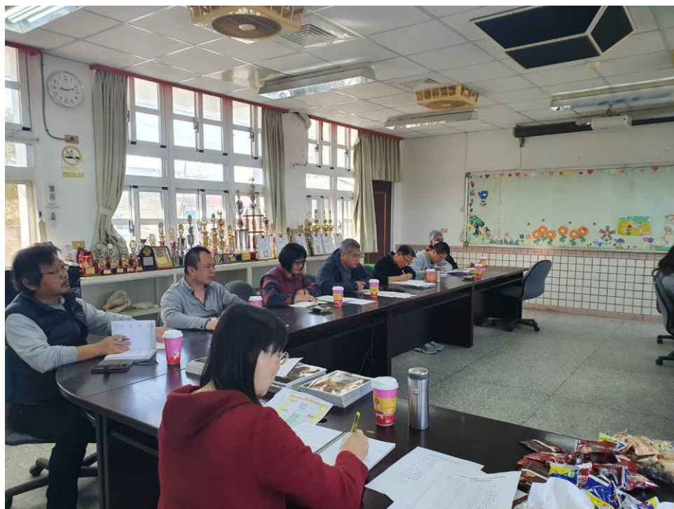
地震避難演練工作協調會議