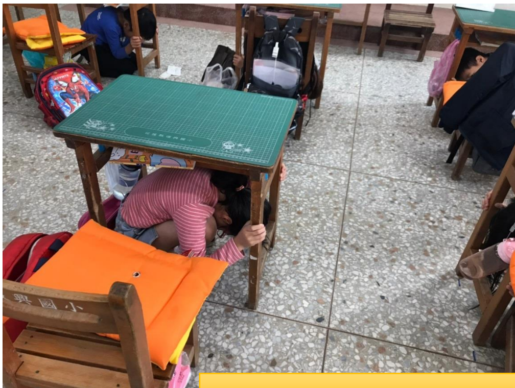
防震警報響起，學生立刻就地掩避。