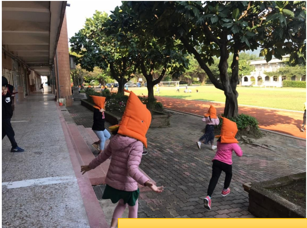
地震稍歇，離開教室到操場集合。