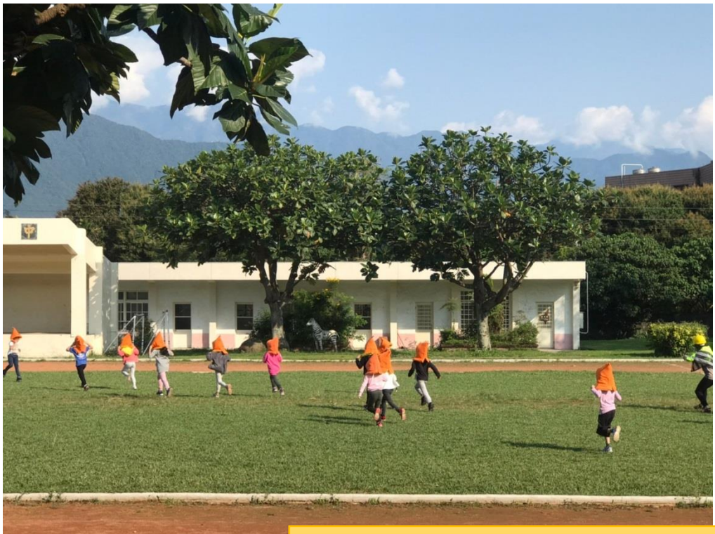
地震稍歇，離開教室到操場集合。