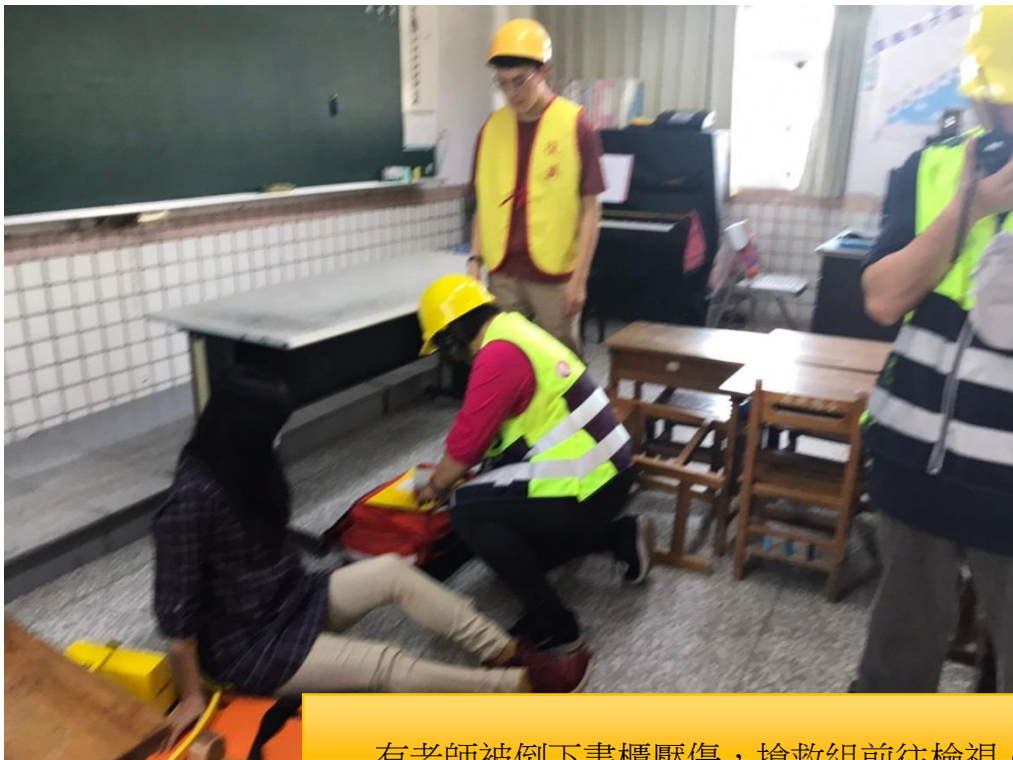
有老師被倒下書櫃壓傷，搶救組前往檢視。