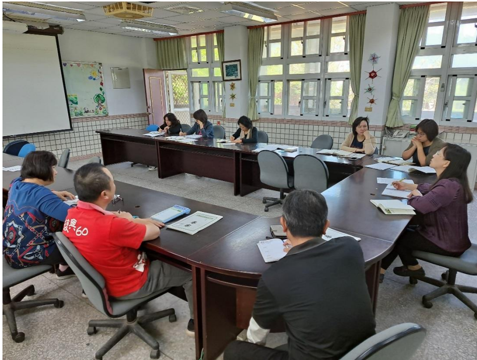
地震避難演練工作檢討會議