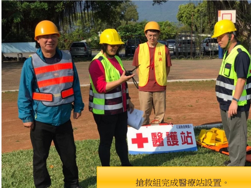
搶救組完成醫療站設置。