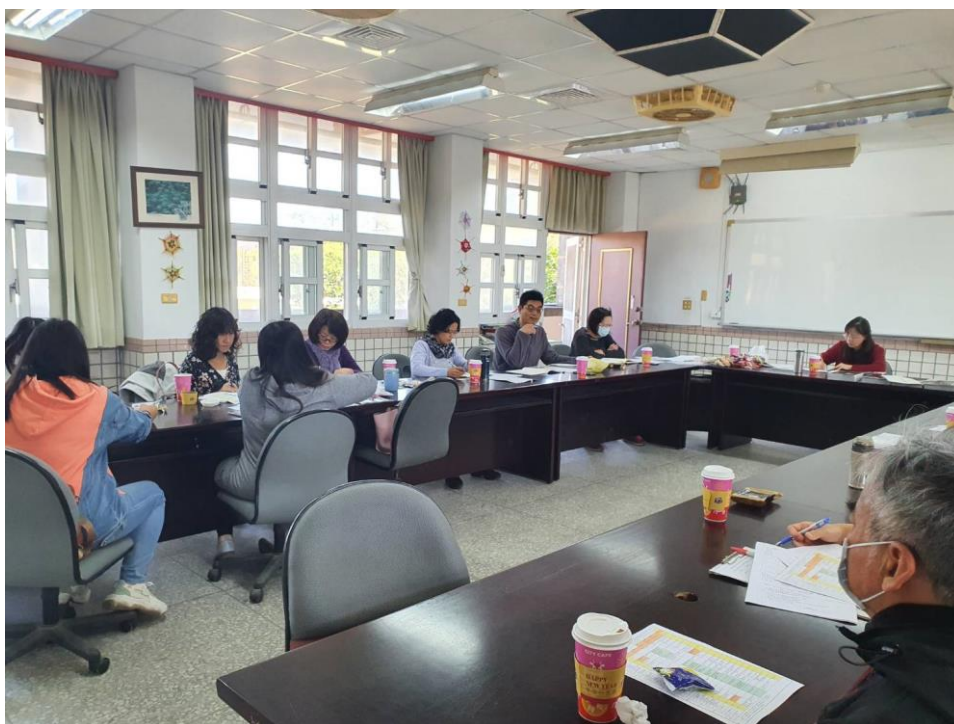
地震避難演練工作協調會議