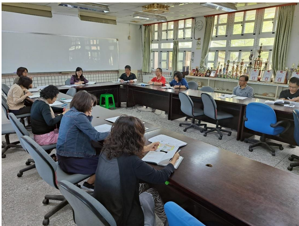
地震避難演練工作檢討會議