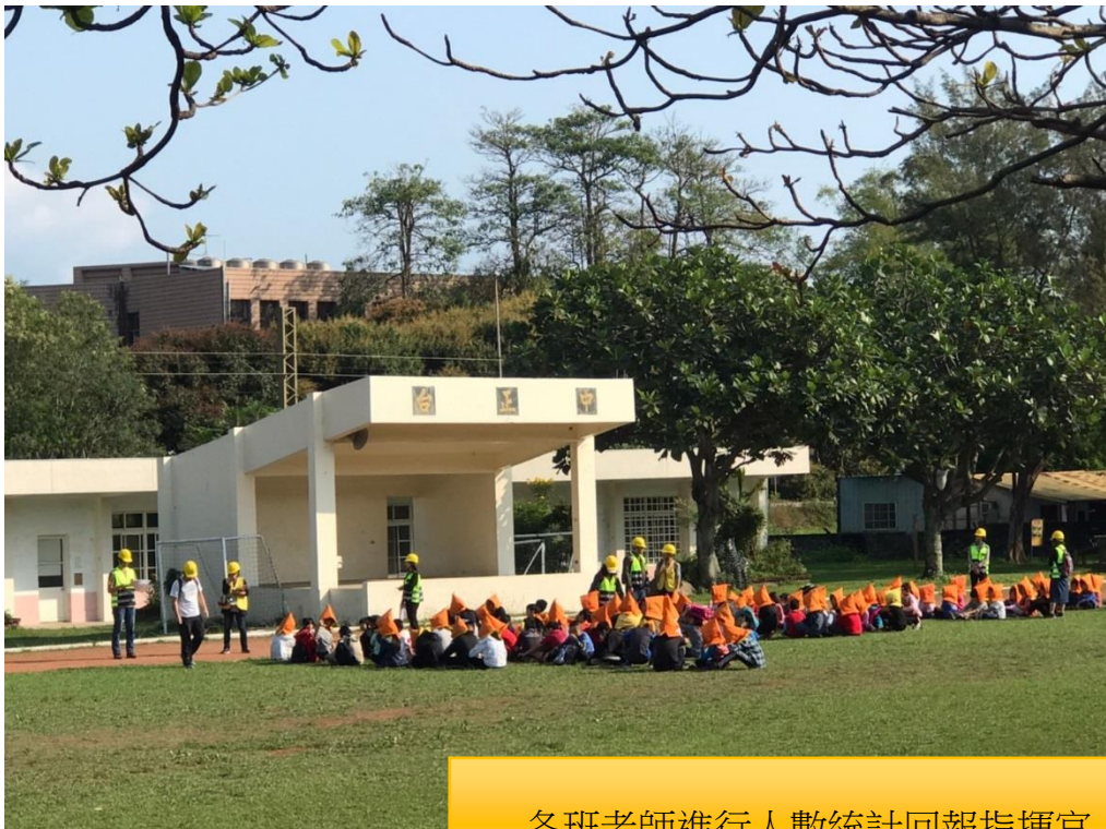
各班老師進行人數統計回報指揮官。