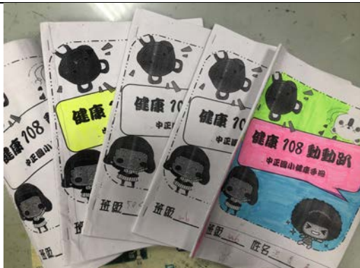
成長班健康手冊：飲食與身高體重變化紀錄