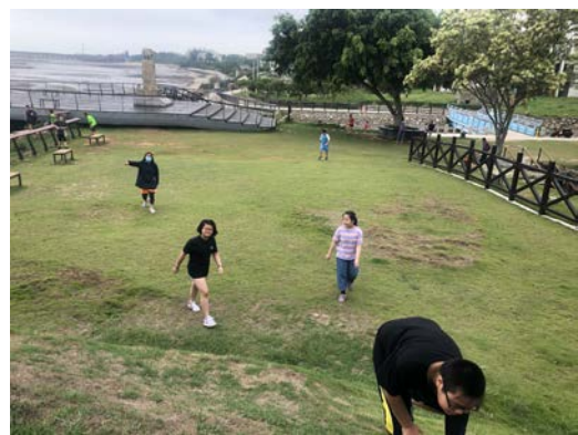
校外健走：同安渡頭