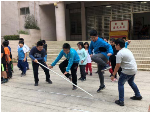
分組競賽：團隊動起來