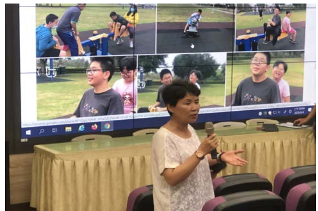
校長給予肯定與勉勵