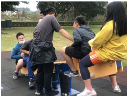
校外健走：長頸鹿公園