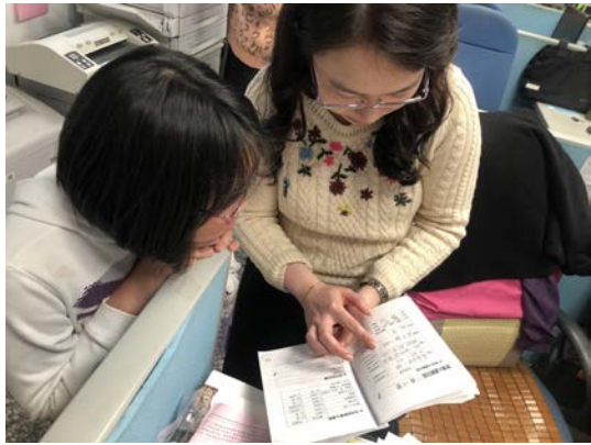
營養師阿姨給予個別化的諮詢與建議