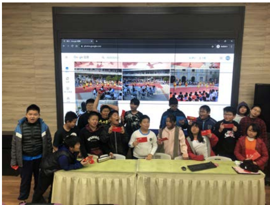
上學期成長班結訓與減重比賽得獎同學合影