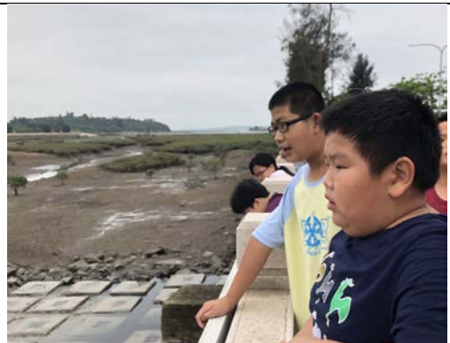
校外健走：浯江溪口