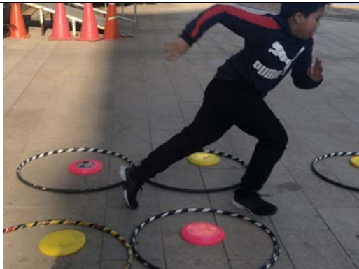
FUNNY BINGO：分組競賽大家都很投入