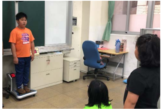
每週量測體重並記錄