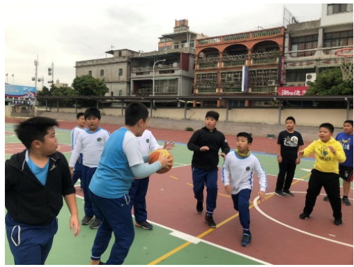
最常打全場籃球賽