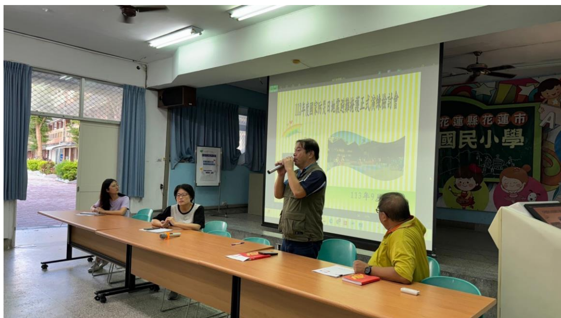
活動說明：正式演練檢討會。