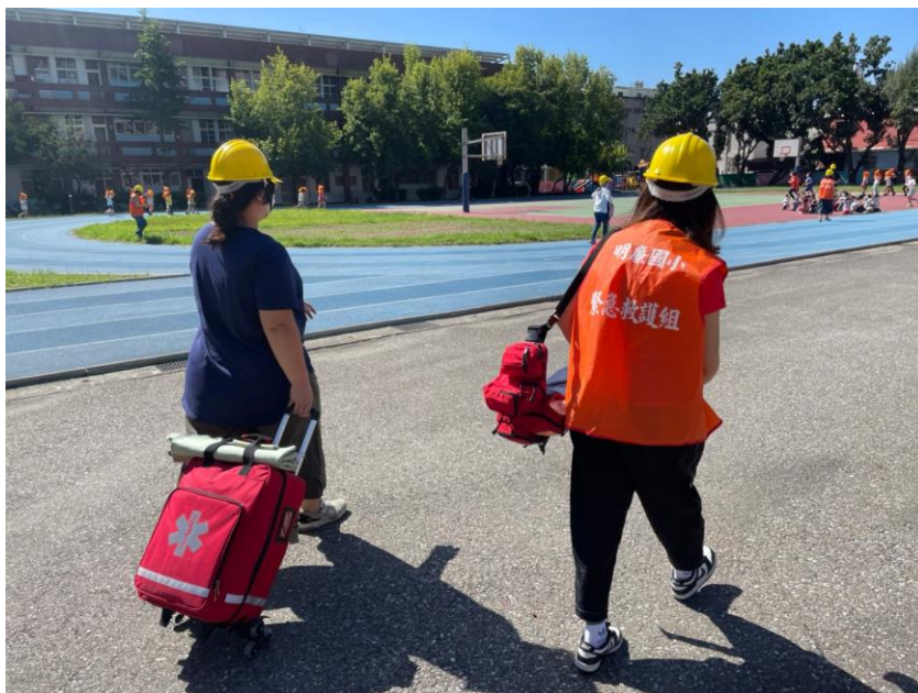
活動說明：救護組迅速備齊救護裝備待命。