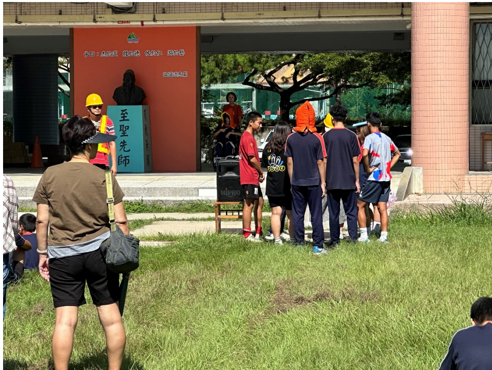
圖片 7 說明