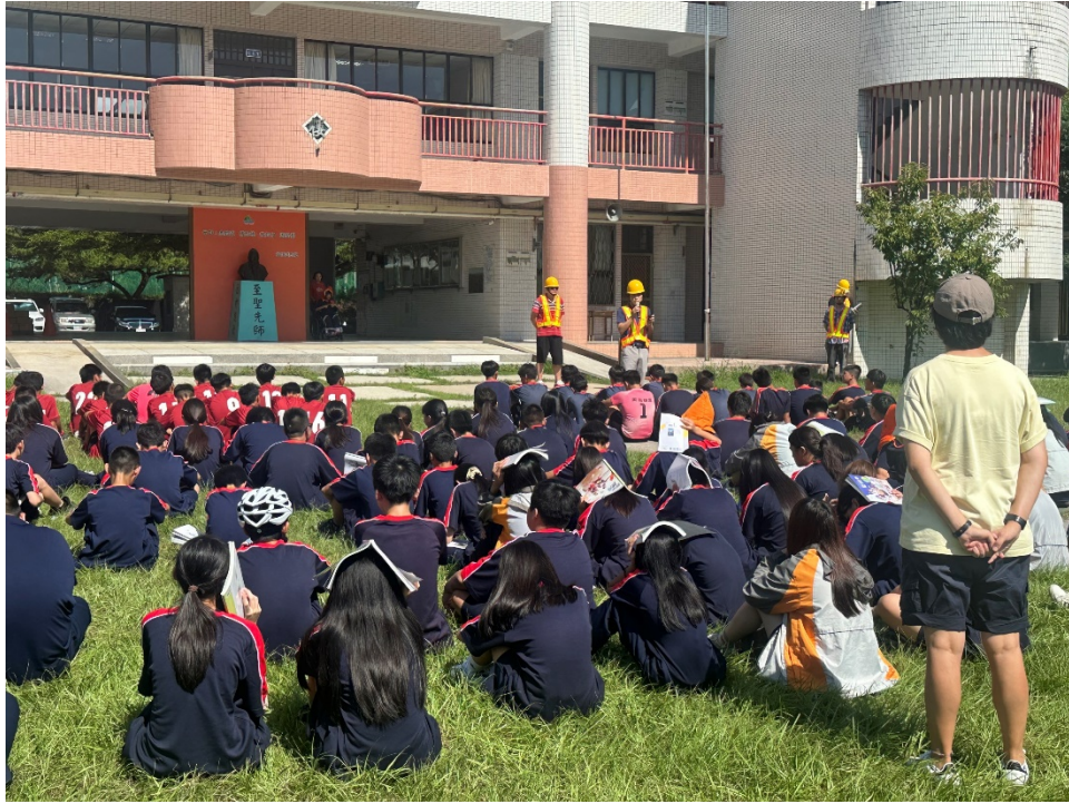
圖片 9 說明 抵達安全疏散地點