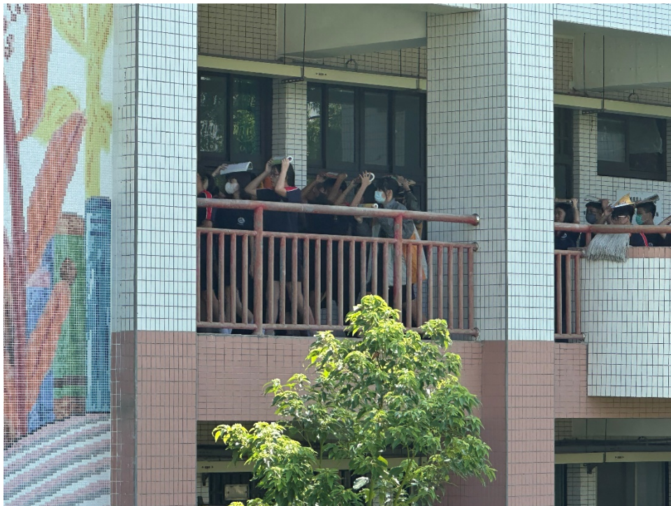
圖片 1 說明