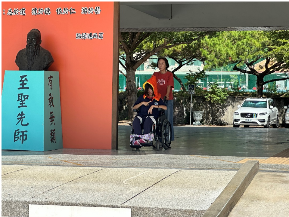
圖片 4 說明