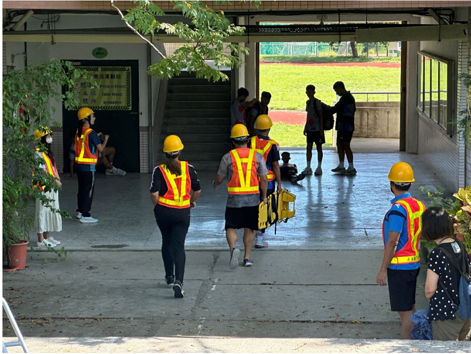
圖片 5 說明 傷患包紮後外送急救站