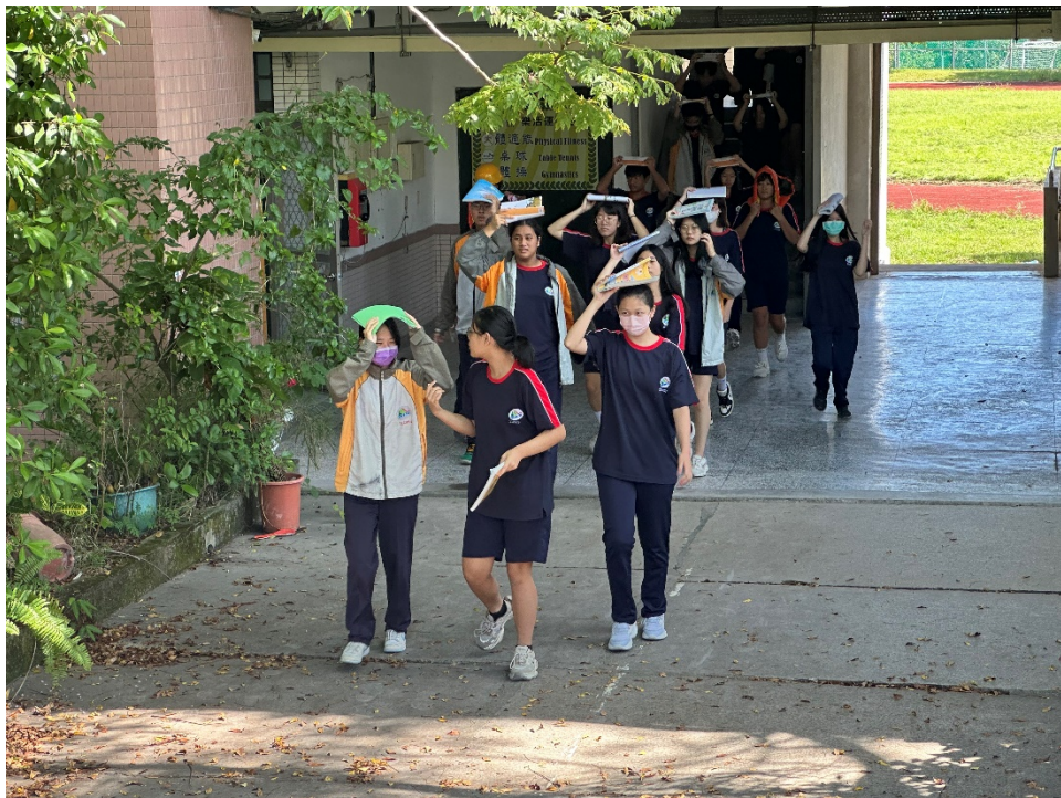
圖片 2 說明