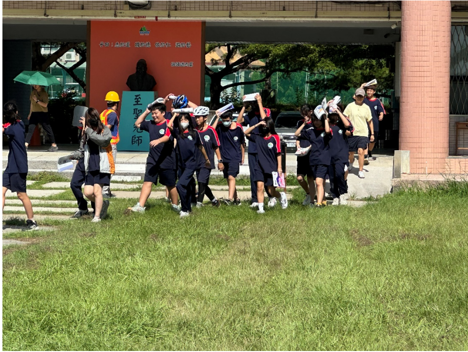
圖片 3 說明