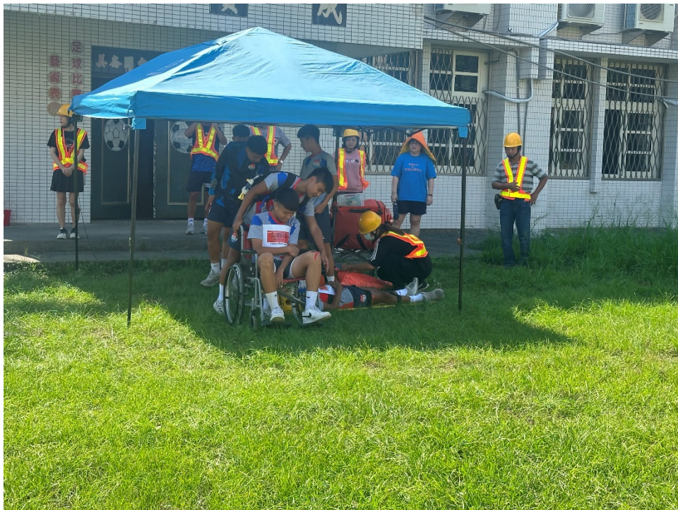
圖片 6 說明 檢傷分類，基本急救