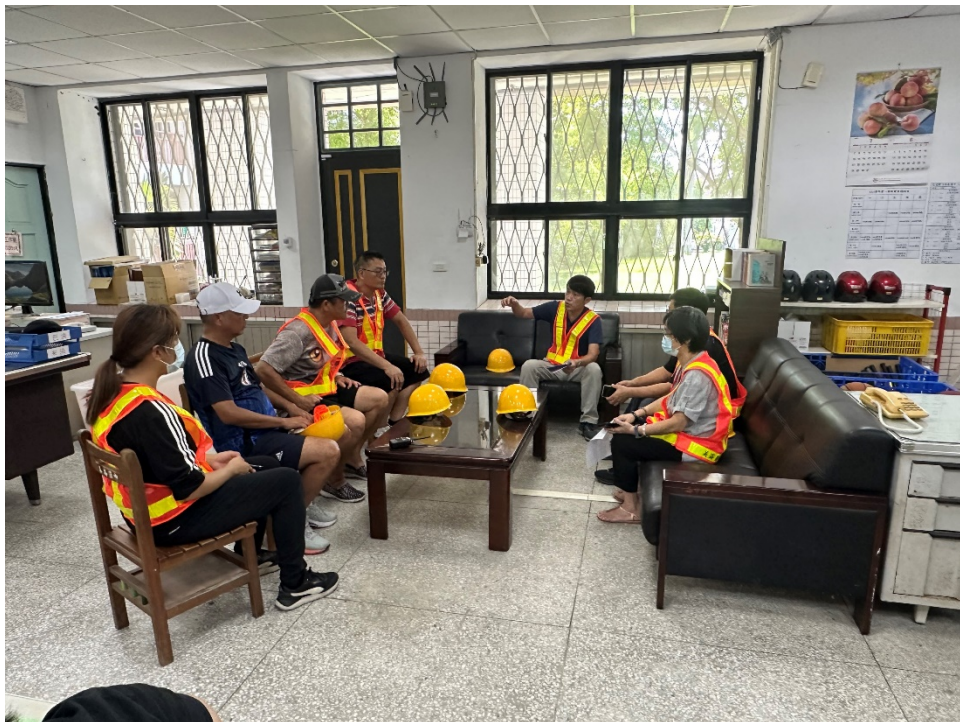
圖片 10 說明 地震避難掩護演練檢討會議