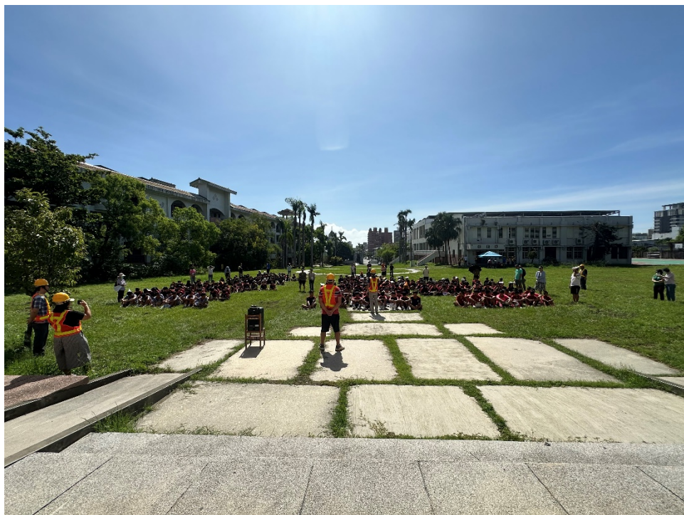
圖片 8 說明