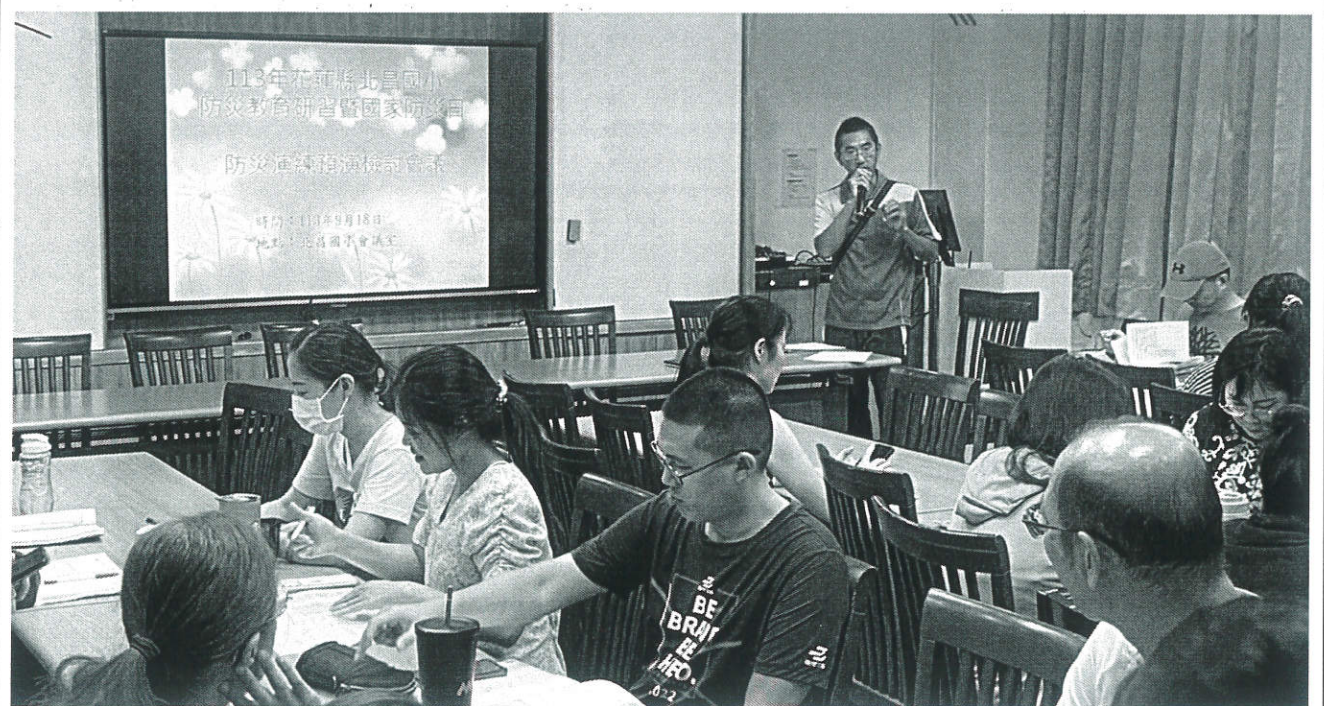
圖片 2 說明