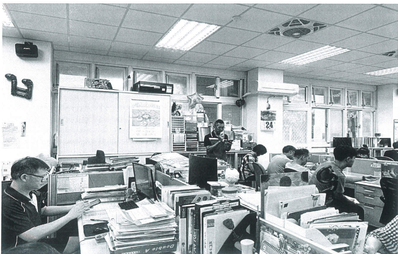
圖片 2 說明