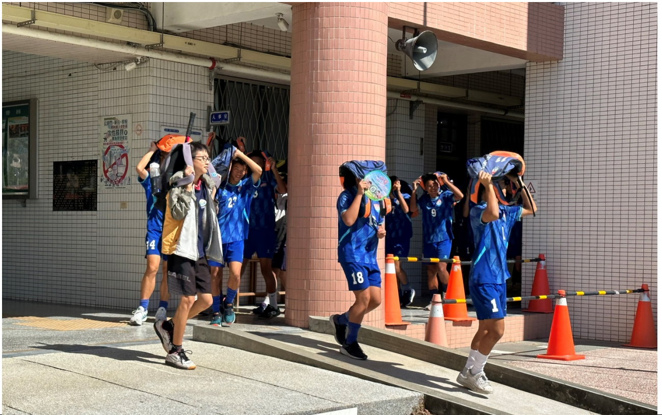
圖片 3 說明