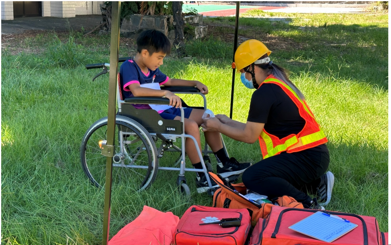
圖片 7 說明