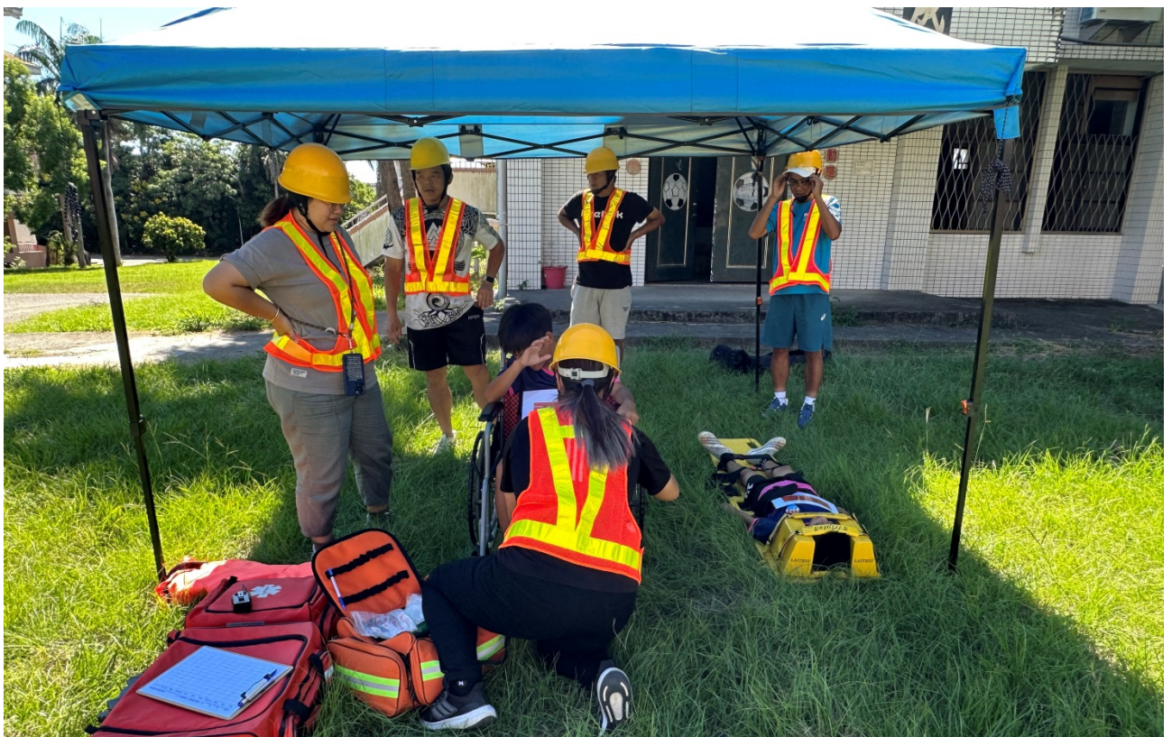
圖片 6 說明