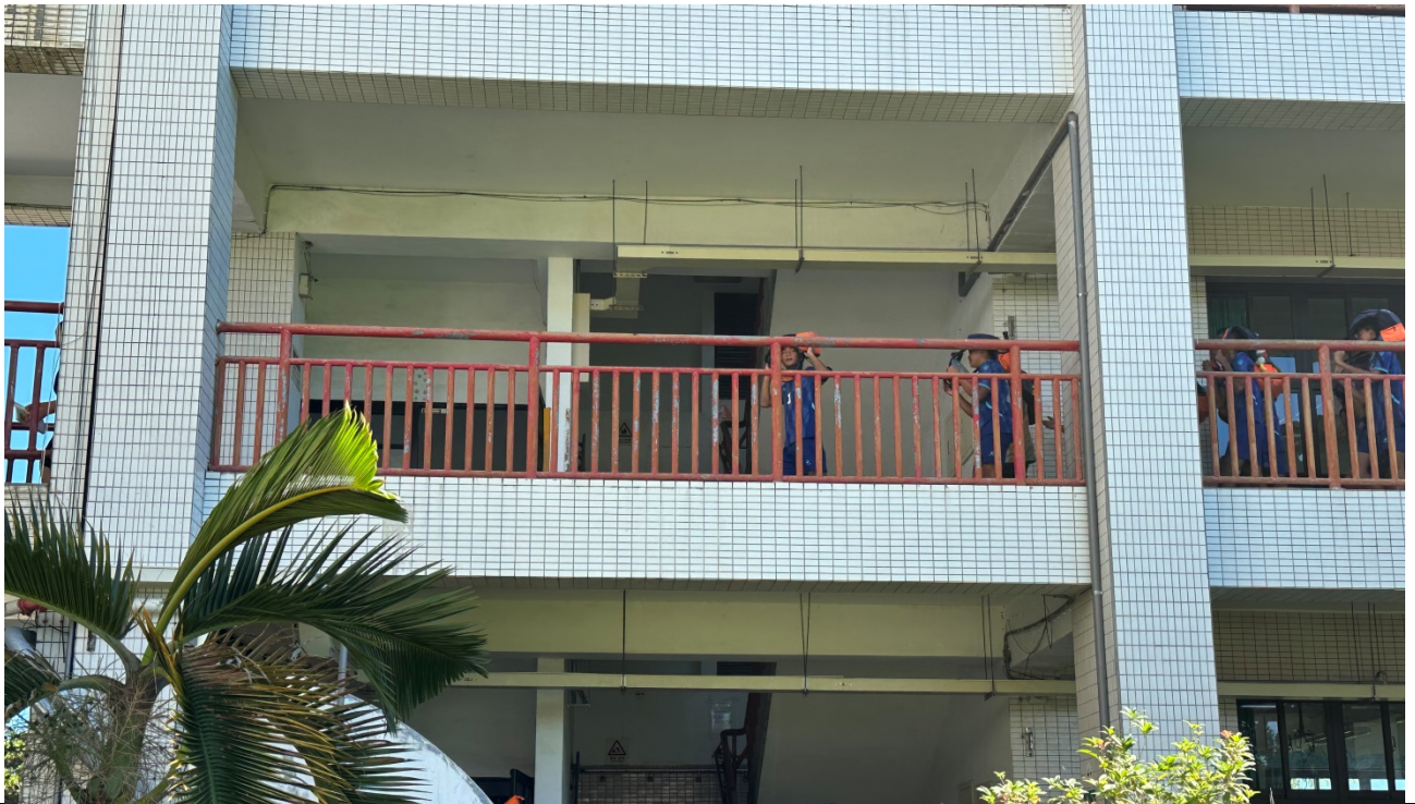
圖片 1 說明