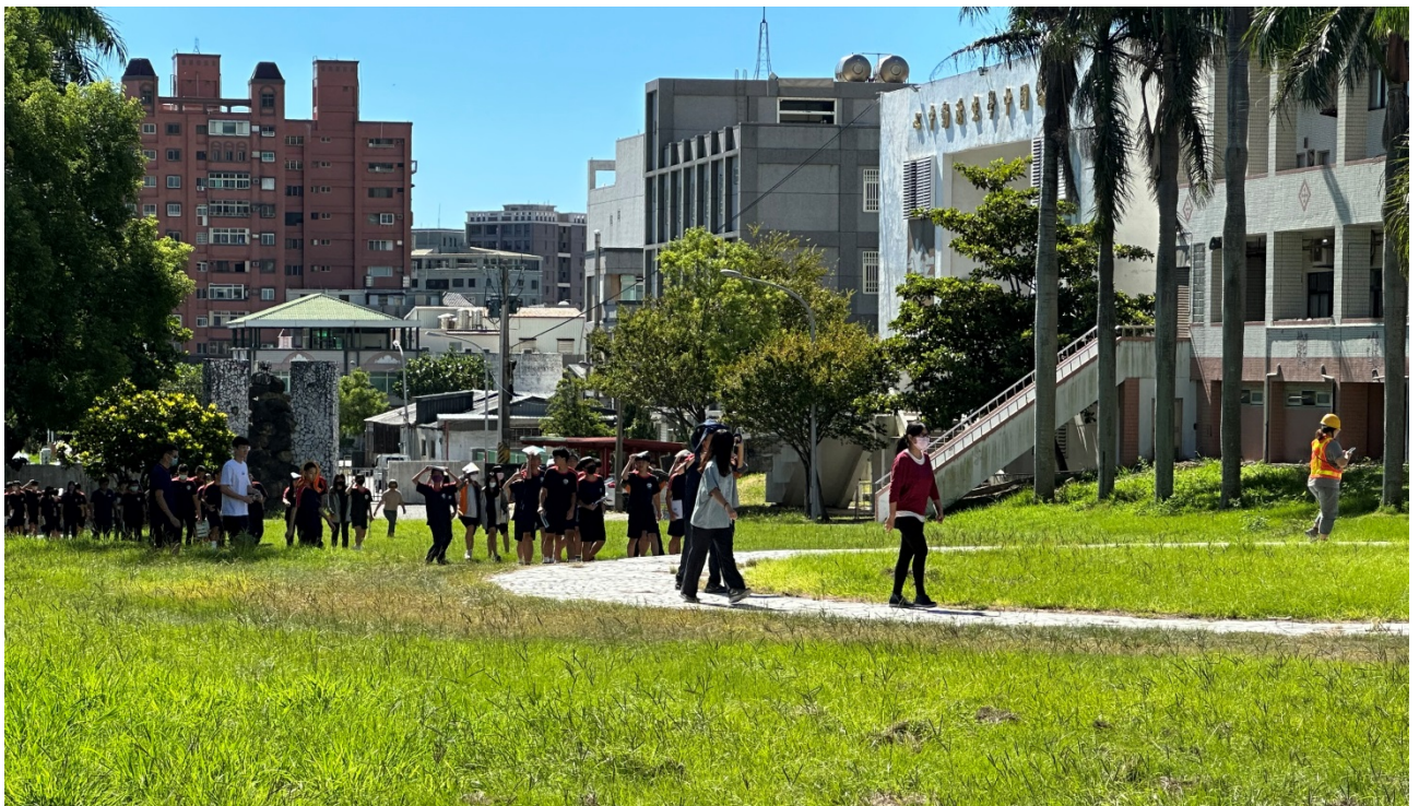
圖片 2 說明