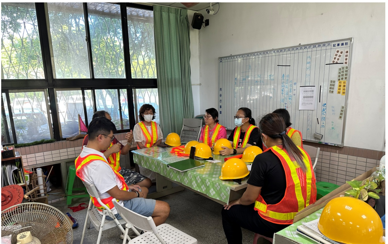
圖片 8 說明