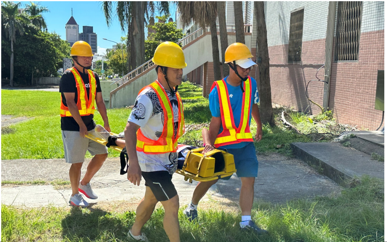
圖片 5 說明