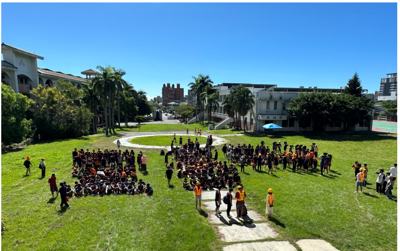
圖片 4 說明