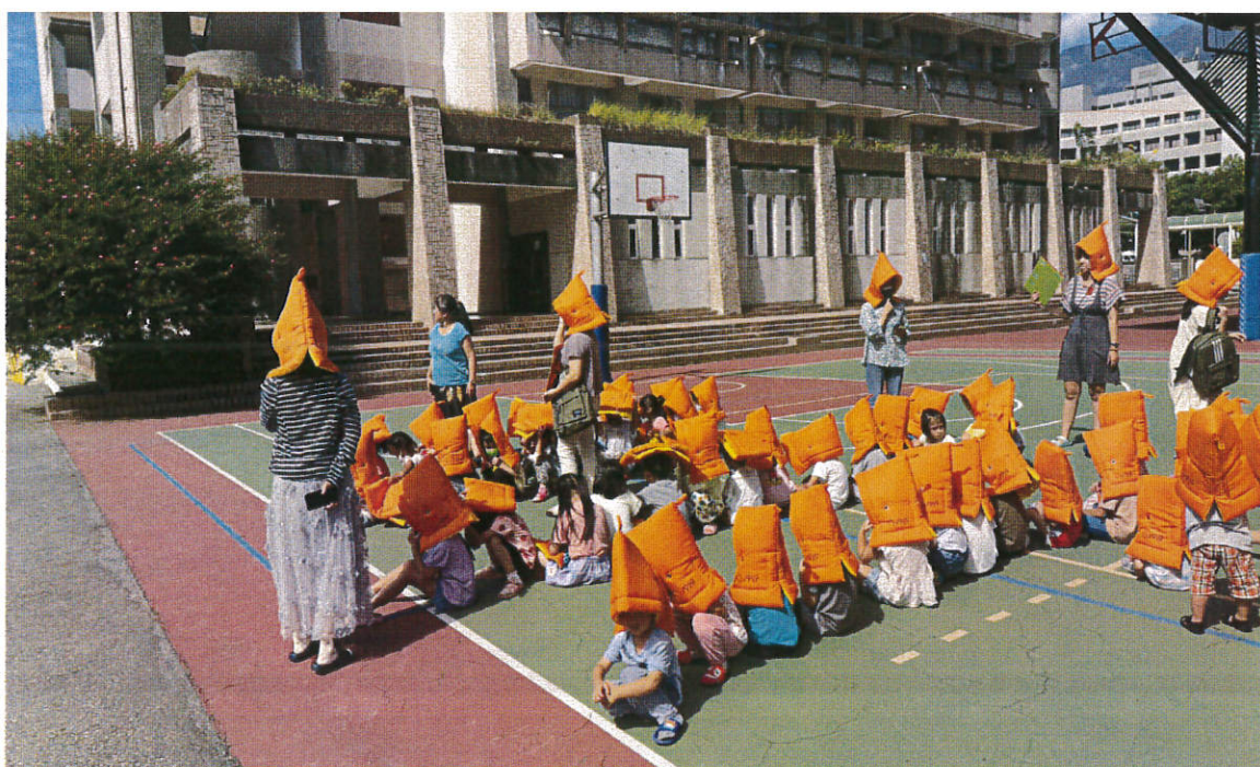
活動說明：幼兒園進行疏散演練。