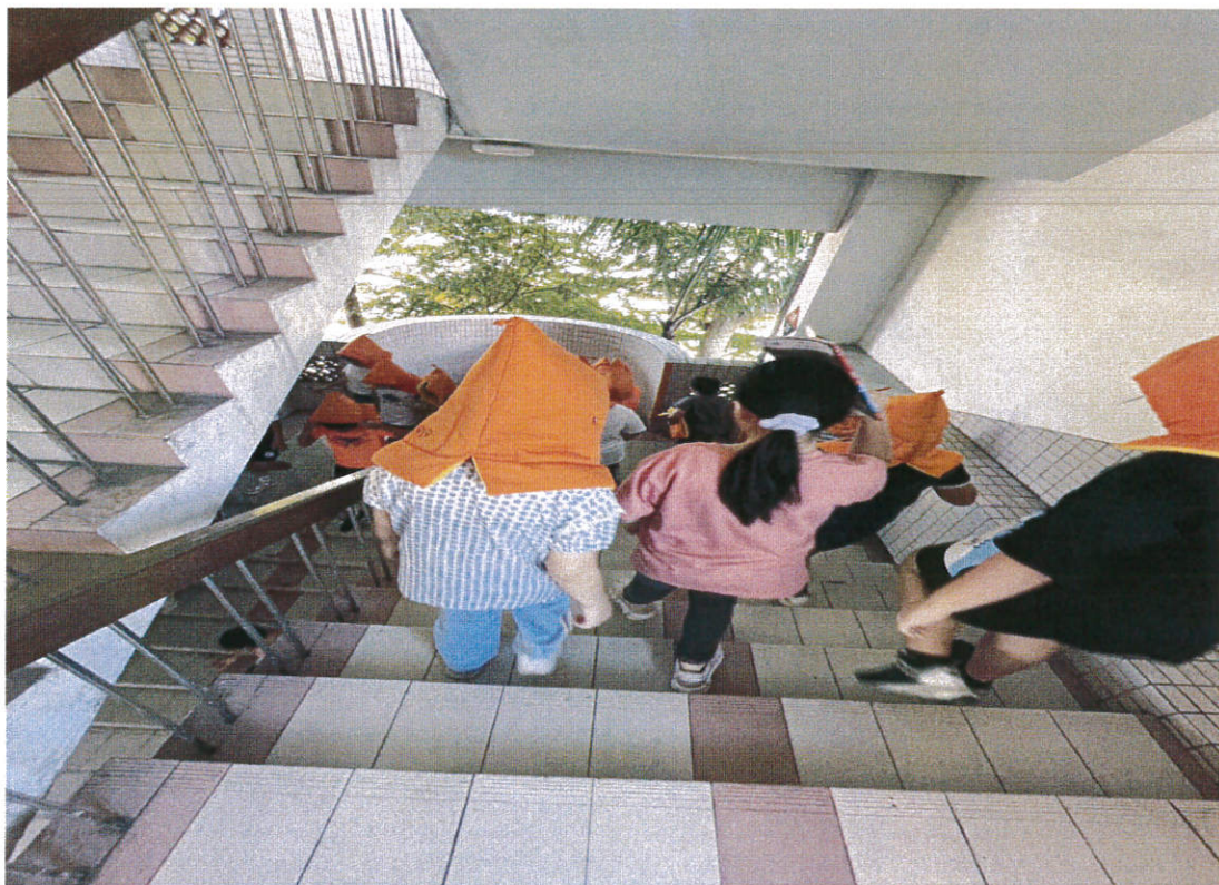
活動說明：學生下樓進行疏散。