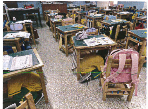
說明：班級防災宣導