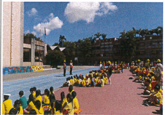
說明：學生完成防災卡