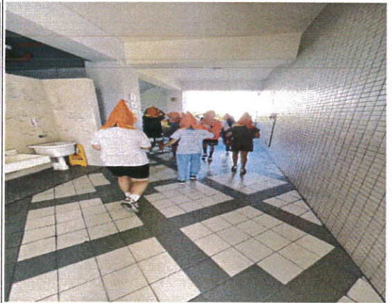
說明：學前特幼預演狀況