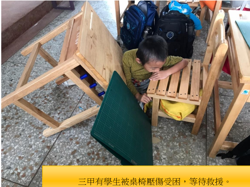
三甲有學生被桌椅壓傷受困，等待救援。