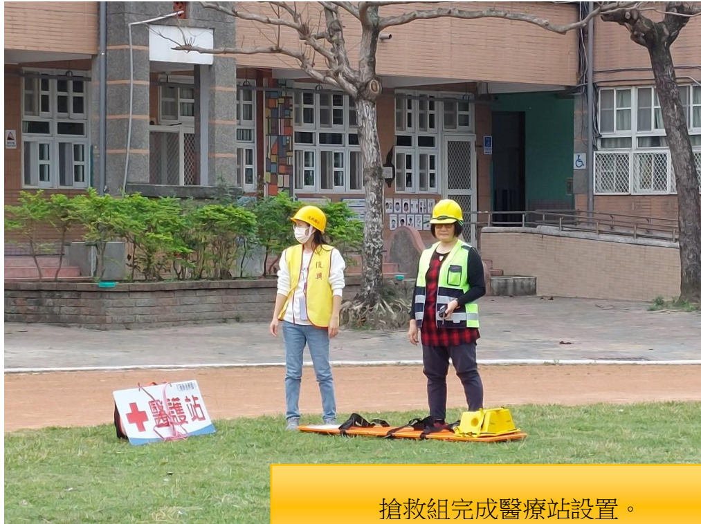
搶救組完成醫療站設置。