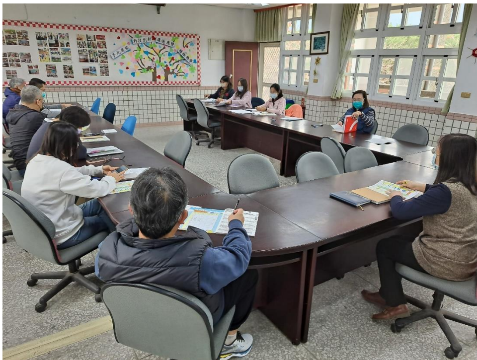
地震避難演練工作協調會議