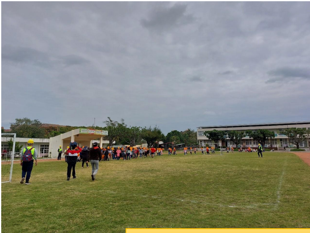
地震稍歇，離開教室到操場集合。