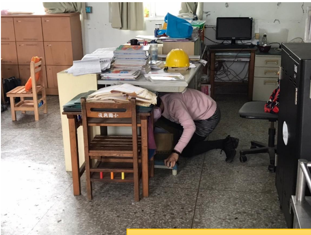
防震警報響起，老師也立刻就地掩避。