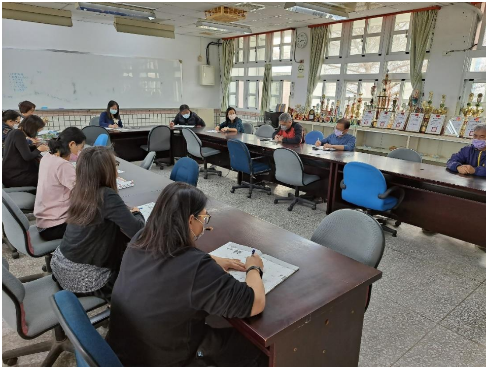
地震避難演練工作檢討會議