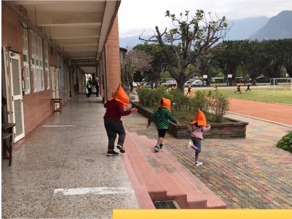
地震稍歇，離開教室到操場集合。