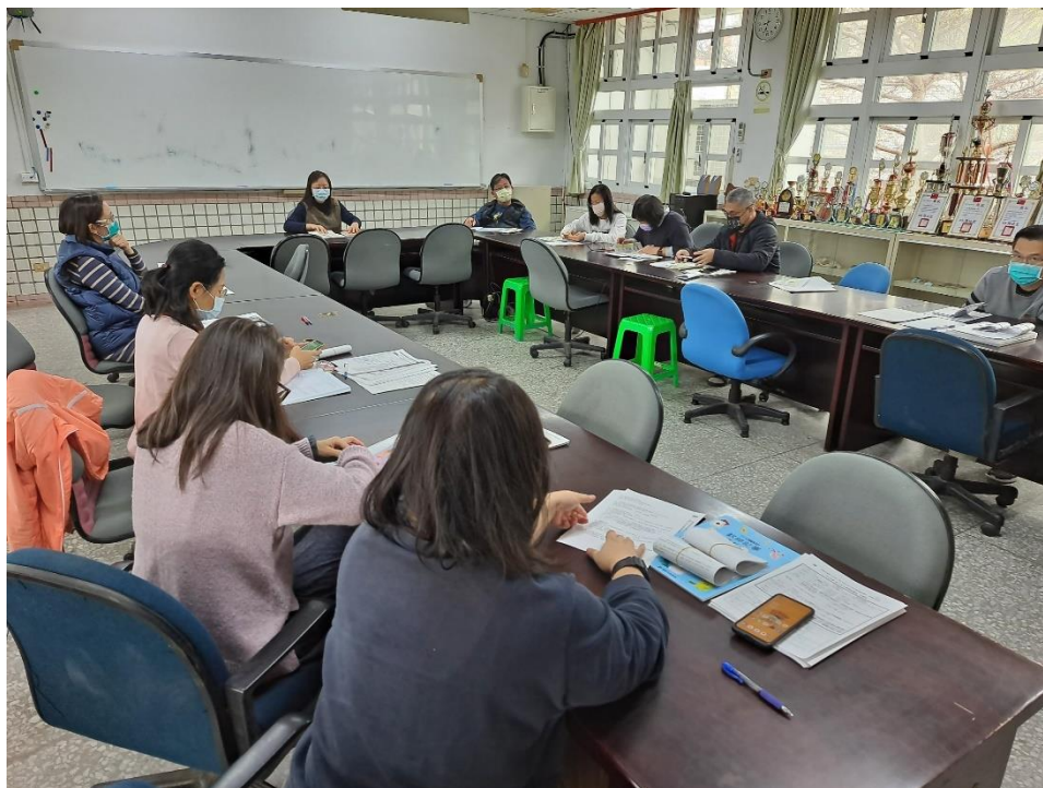
地震避難演練工作協調會議