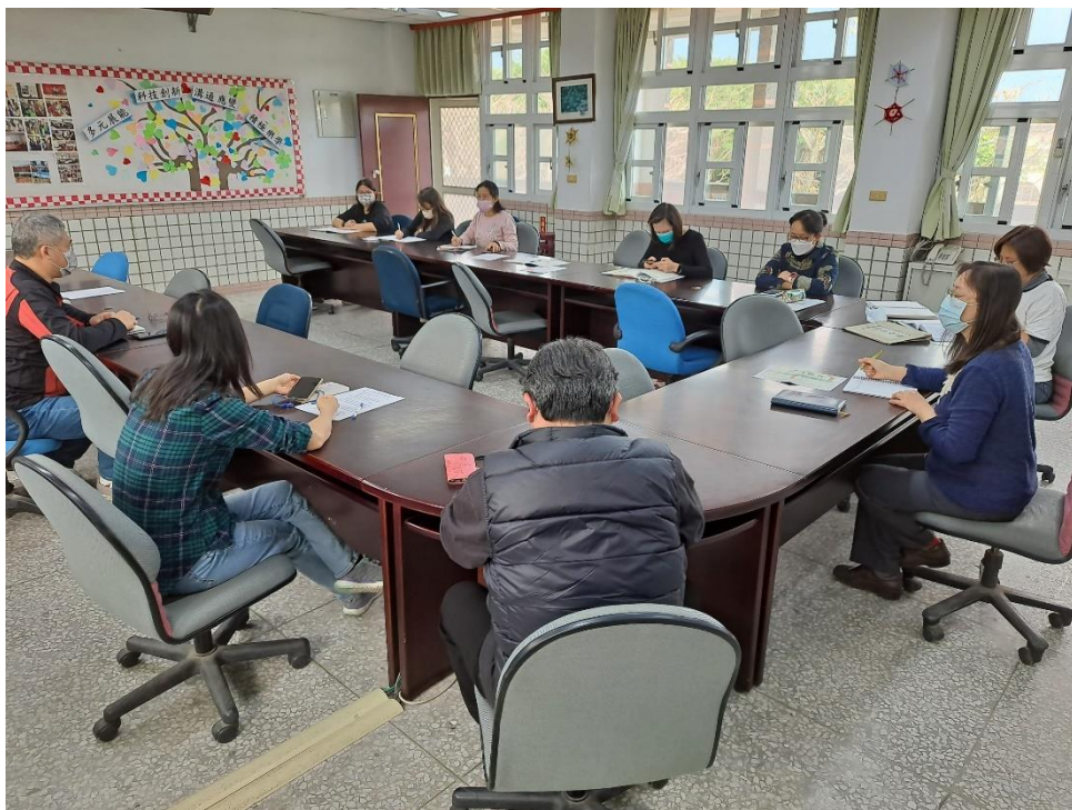
地震避難演練工作檢討會議