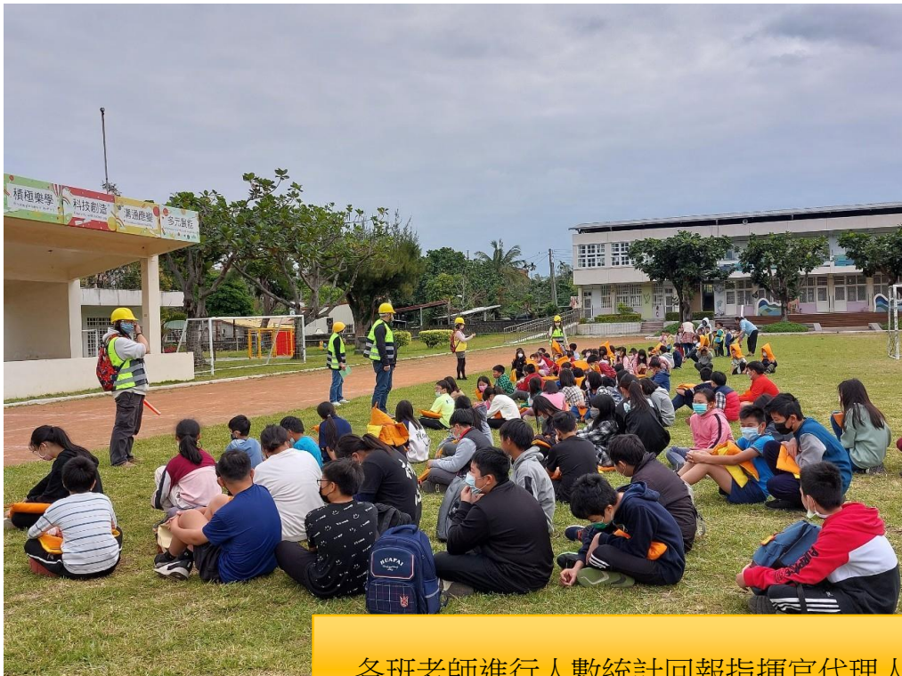
各班老師進行人數統計回報指揮官代理人。