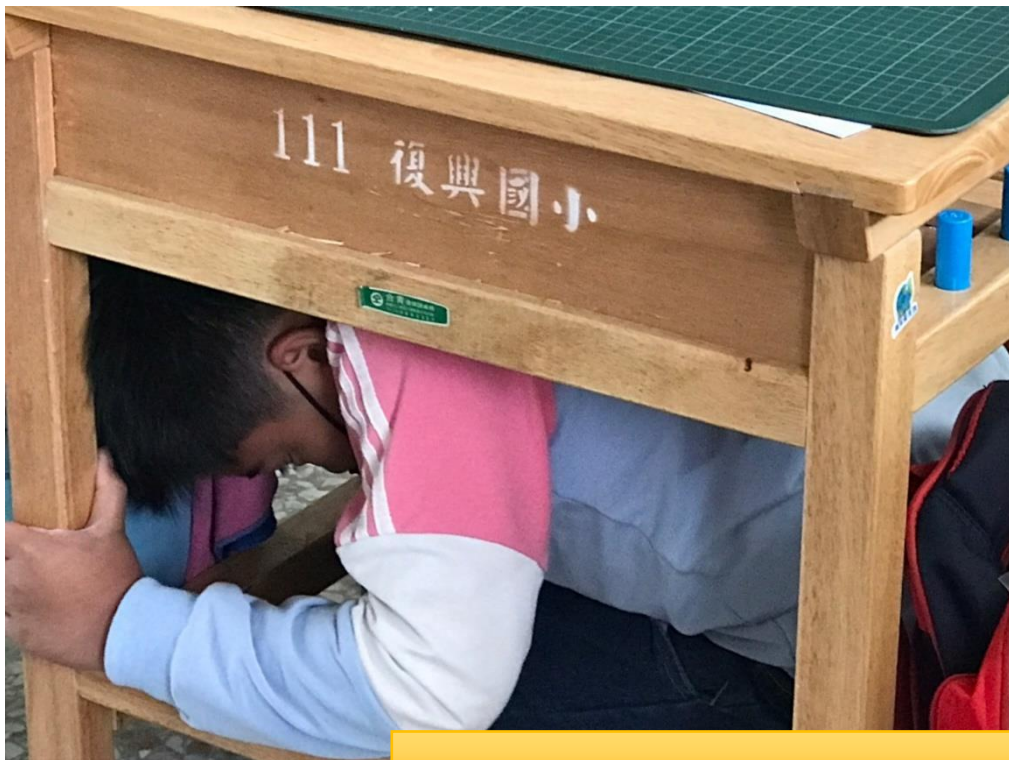
防震警報響起，學生立刻就地掩避。