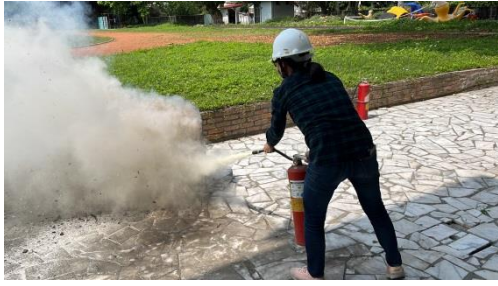
模擬地震導致廚房火災，進行初級滅火。