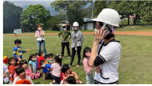
通報組最後做災情通報。