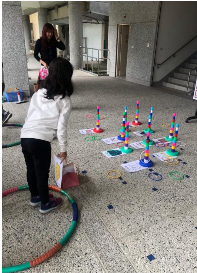
透過遊戲讓學生認識避難包