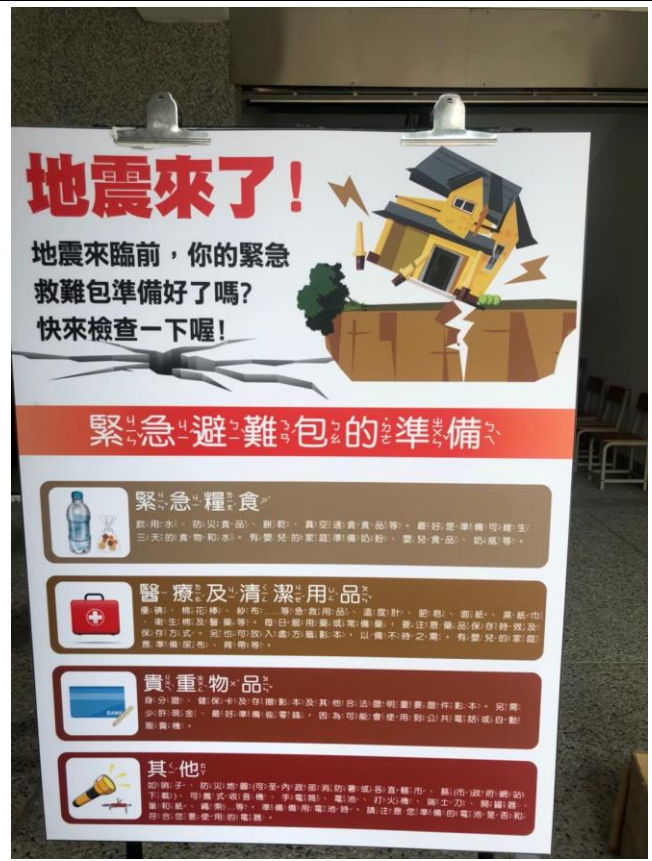
認識地震避難包的內容