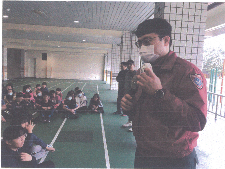
活動說明：消防隊介紹消防設備