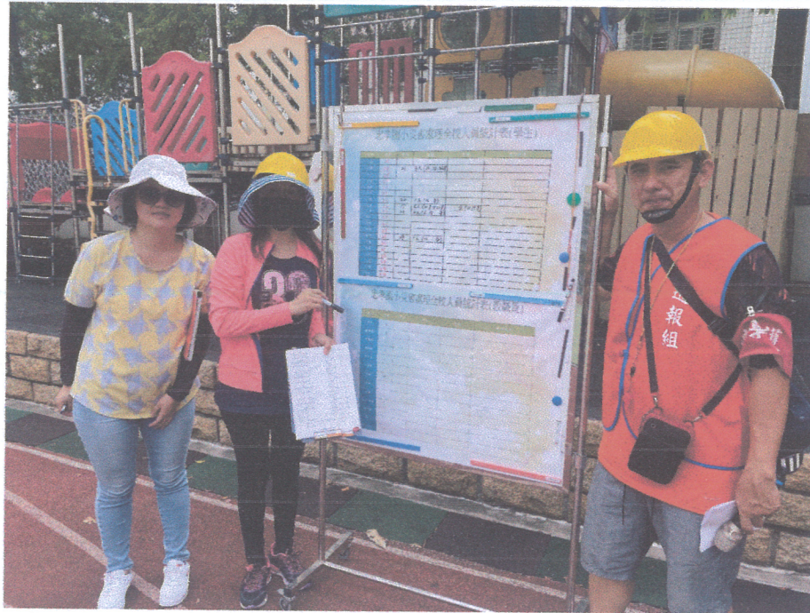
活動說明：各班回報人數並記錄。