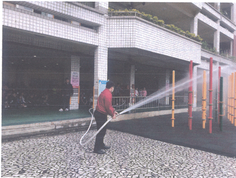
活動說明：消防隊員示範消防水帶的使用。