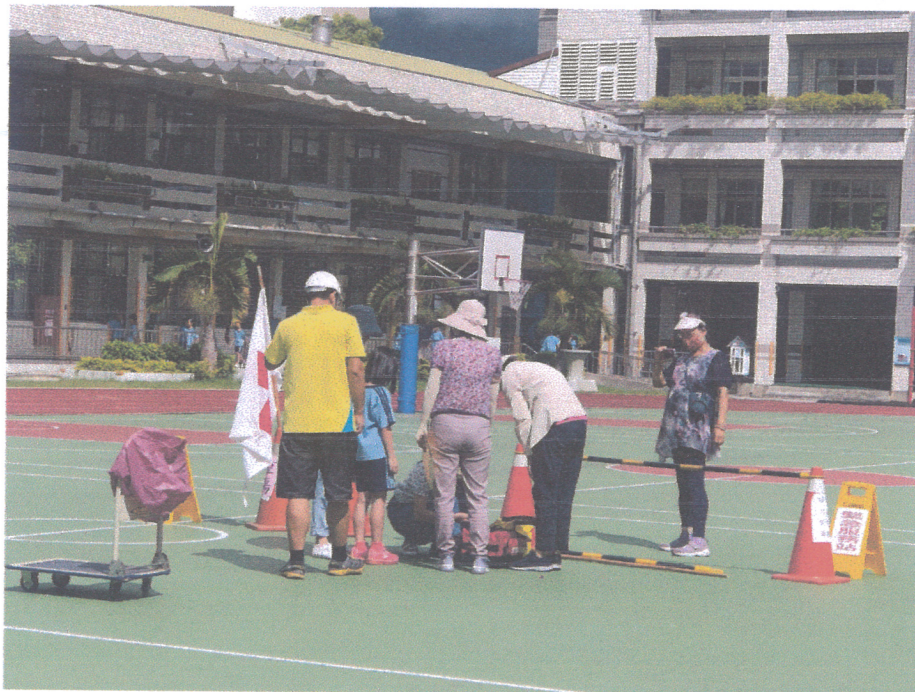
活動說明：檢傷分類與輕傷處置