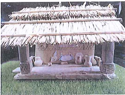
5. 陶土屋搖晃實驗前