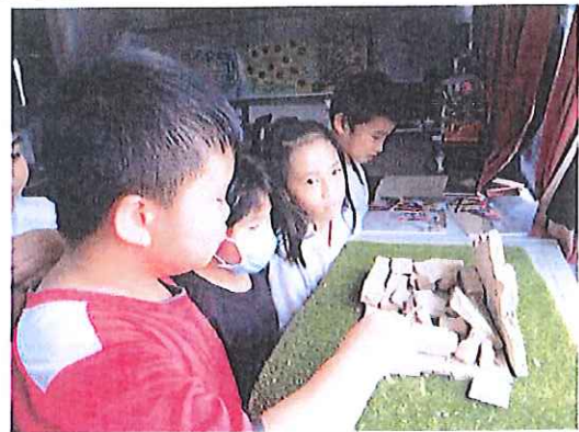
6. 陶土屋搖晃實驗後