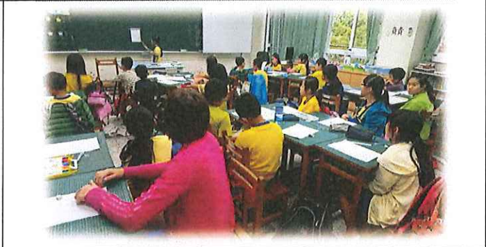
發表分享小組所繪製之校園避難逃生路線圖