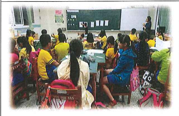
有物品或牆倒阻隔逃生路線,怎麼辦?學生回答