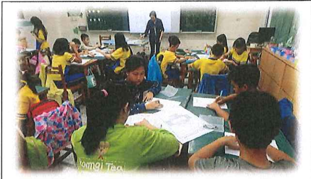
各組討論繪製校園避難逃生路線圖