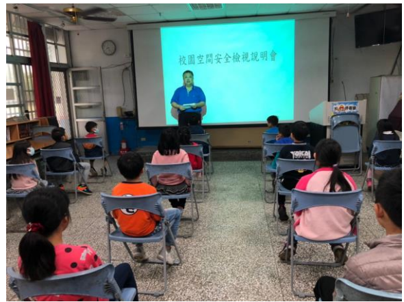
總務主任說明校園安全