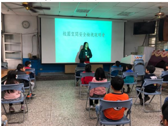
訓導組長說明校園安全