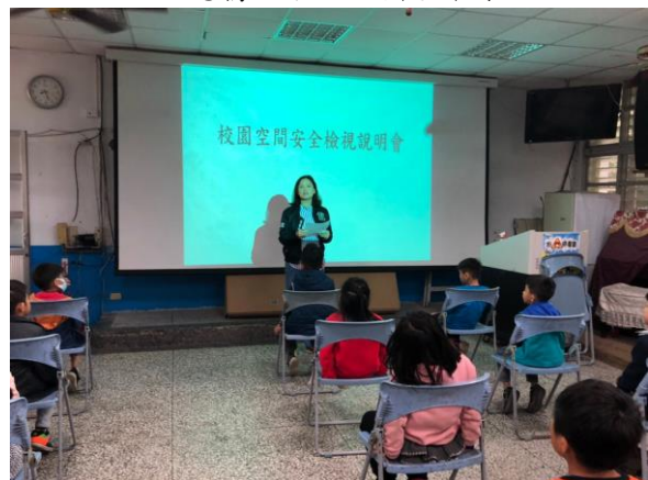
教導主任說明校園安全