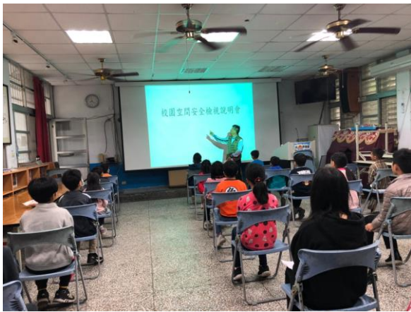
校長說明校園安全