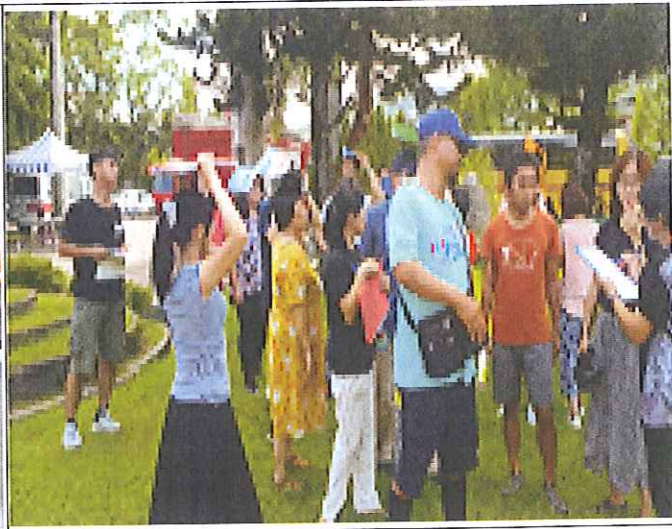
各組就定位的畫面