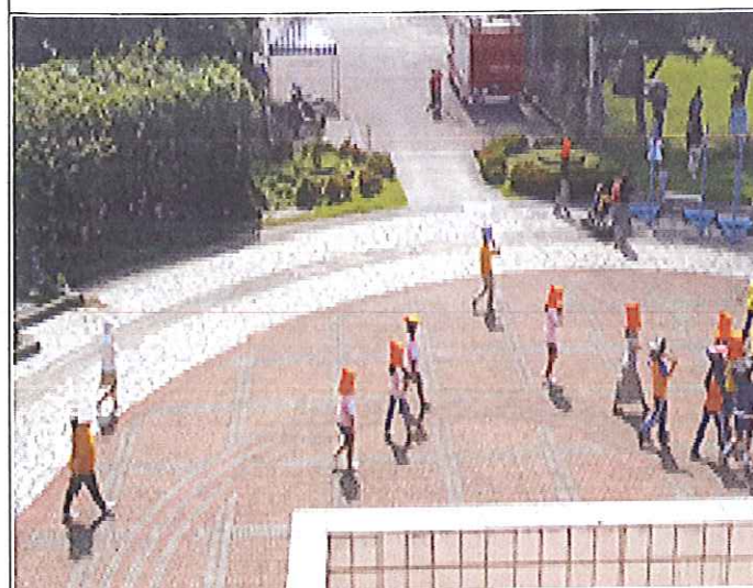
同學往避難處集合之情景