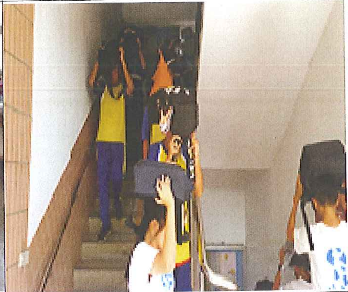
各班級依避難路線迅速疏散