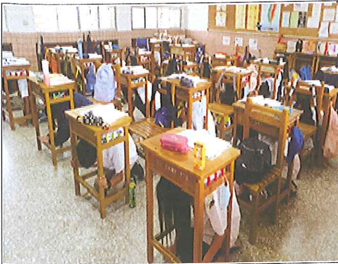
地震發生正執行 趴下、掩護與穩住 的動作