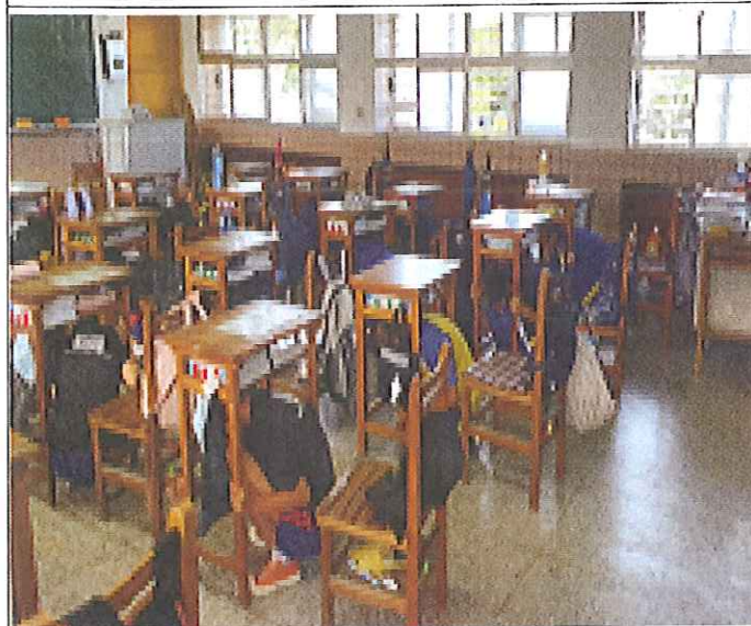
地震發生-執行 趴下 、 掩護 與 穩住 三要領