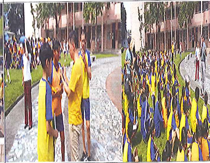
地震發生-人數統計與回報