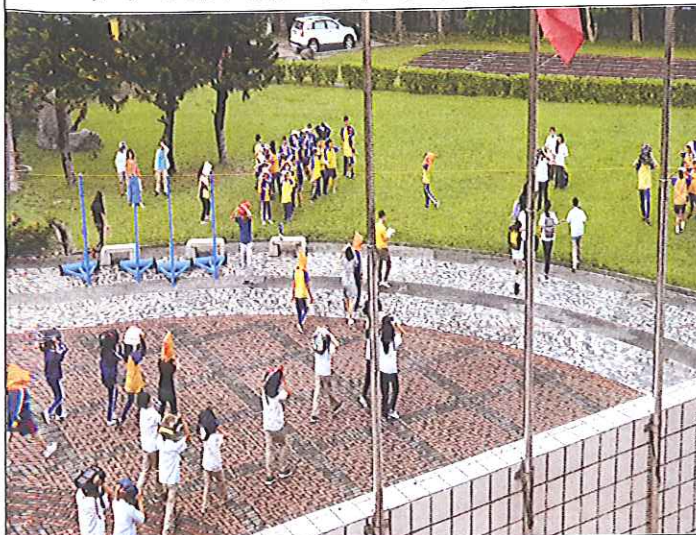
保護頭部迅速下樓集合之情景