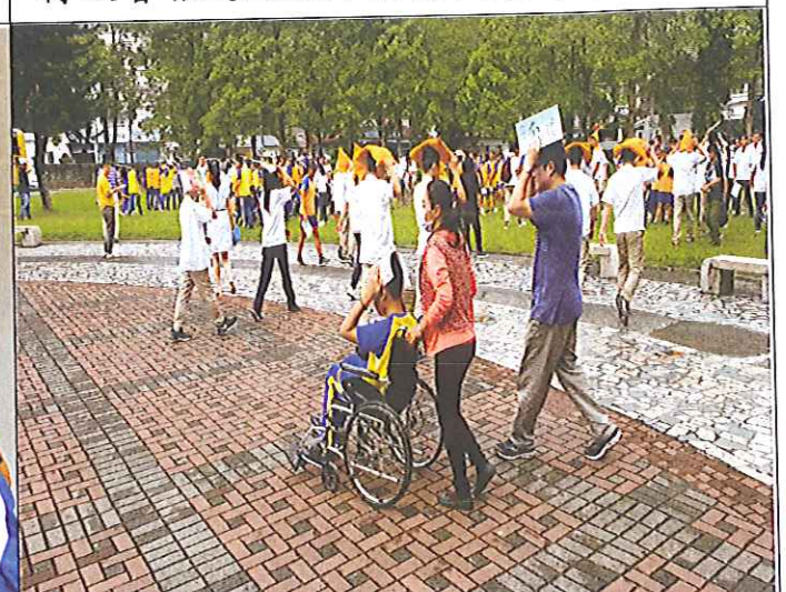
志謀老師協助行動不便同學疏散的畫面