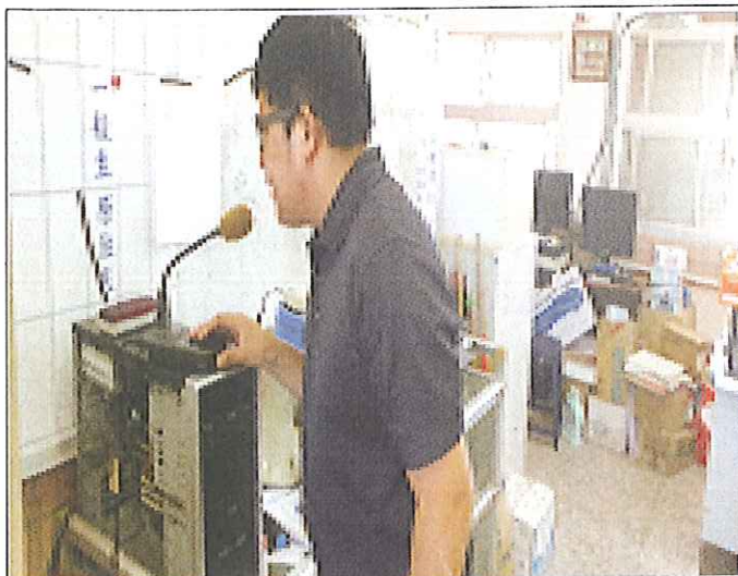
地震演練-主持人志中廣播