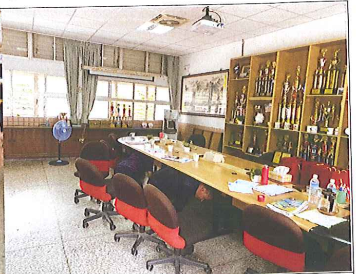
行政會報適逢演練落實 抗震保命三步驟