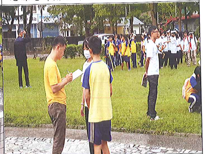
各班級確實清點後逕向避鬧引導組回報