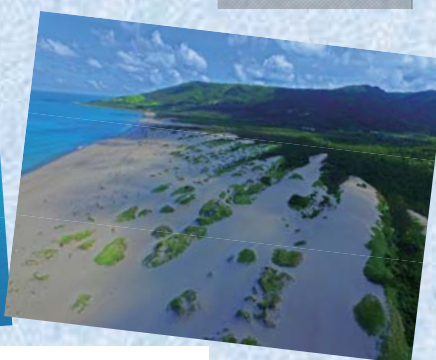
牡丹鄉旭海沿岸及滿州鄉九棚沙漠